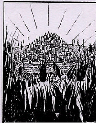
Tod der Gottlosen