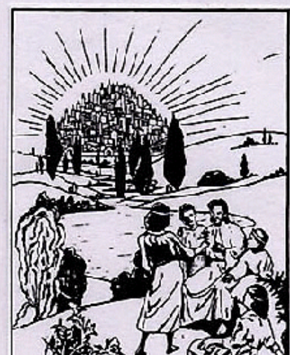
Die neue Erde